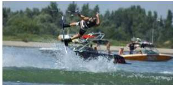
Wakeboard Boote & TOP Rider aus ganz Europa

Das Zelt wird für euch aufgebaut und darf danach behalten werden!!!