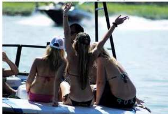
das Chill & Ride Festival lockt alle an!