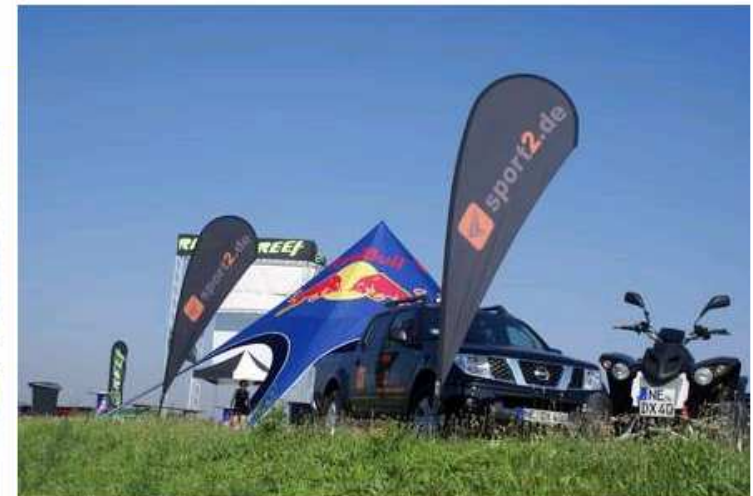
Chill and Ride 2008 Foto 1

1 2 3 4 5 6 7 8 9 10 11 12 13 14 15 16 17 18 19 nächste >